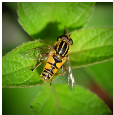
Blomsterflue (Vanlig solflue)